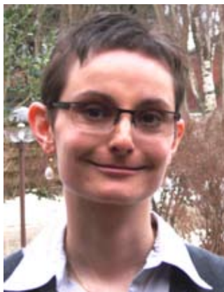
Bogen er redigeret af Lisbeth Riisager Henriksen

Bogen handler om det at leve med kronisk sygdom eller handicap og er skrevet til mennesker, der enten mærker dette på egen krop eller er pårørende. Hvad i alverden er meningen? ønsker at oplyse om en række eksistentielle problemstillinger og overvejelser, som sygdom og handicap kan medføre. Desuden vil den sætte ord på den religiøse dimension ved livet med sygdom og handicap.